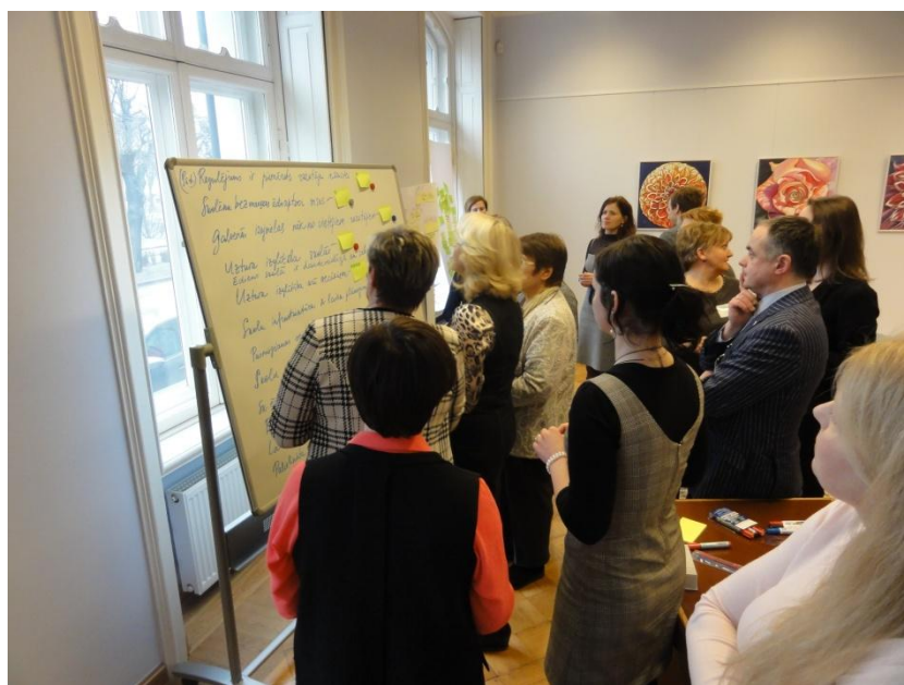
Balsojums par skolēnu ēdināšanas skolās galvenajiem mērķiem.

Šī situācija tiek risināta dažādi, tomēr galvenie risinājumi paredz, ka skolēni ņem līdzī ēdiena kastītes no mājām, pie skolām tiek atjaunoti dārzi, pašās skolās tiek atjaunota infrastruktūra, lai varētu maltītes gatavot uz vietas. Šajās skolās nostiprinās bartera sistēma un solidaritāte. Šie procesi arī maina mācību procesu. No vienas puses, skolas pievērš lielāku uzmanību uztura zināšanu pilnveidošanai. No otras puses, palielinās skolēnu skaits, kuru vecāki izvēlas vispār nesūtīt bērnus skolā, bet izglītot viņus mājāmācības ceļā.