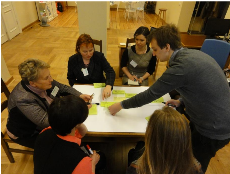
Darbsemināra 3. grupas dalībnieki diskutē par veidiem, kā sasniegt skolēnu ēdināšanas mērķus.

nāšanā – jāpalielina gan skolēnu ēdināšanai atvēlētais finansējums, gan arī finansējuma daļa, ko ēdinātāji atvēl produktu iegādei. Tāpat būtu jāvienojas konkurētājam uzņēmumam un