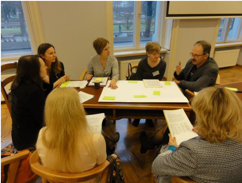
1. grupas dalībnieki diskutē par skolēnu ēdināšanu Latvijā.

Uzņēmumu atbildības jomā viens no uzdevumiem ir panākt to, ka skolu pārtika ir kičīga, stilīga un veselīga. Lai to sasniegtu, uzņēmumiem būtu jādomā par pārtikas dienām skolās, bukletiem un citiem informatīviem materiāliem. Bet jau pirms tam būtu jāapvienojas skolu ēdināšanā iesaistītajiem pārtikas uzņēmumiem, lai kopīgi vienotos par pieņemtajām ēdināšanas praksēm, un jāveido partnerības starp pašvaldību un skolu ēdināšanā iesaistītajiem uzņēmumiem.